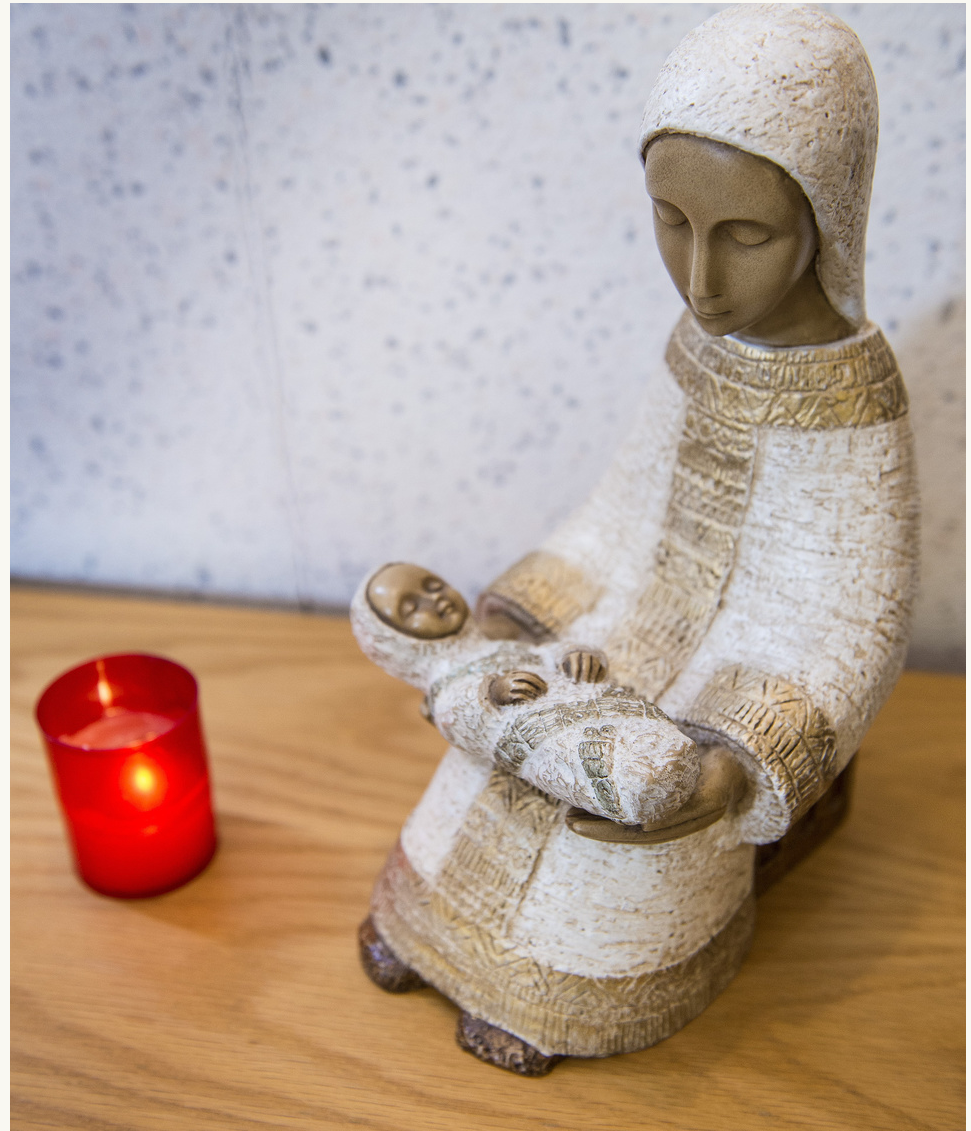
↪ Ik hou van Maria, haar eenvoud en toewijding aan Jezus. Zo godverbonden, zo mensnabij. Elke ochtend vertrouwen we ons haar